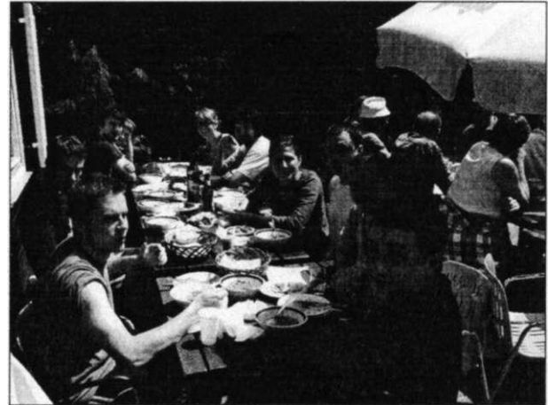
Slika 1. Nema boljeg jela od graha s kobasicama.

Pri povratku kući mnogi su se od nas, po starom običaju, zadržali u Samoboru uz dobru kavu i kremšnite.